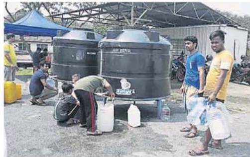
居民和外劳排队取水。

多，水供公司除安排水车派水，也在该花园回教堂旁设立取水站，让受影响居民到该处取水。