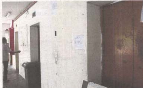
The lifts at PPR flats need to be in working condition or the disabled cannot leave their houses.

"The construction industry impacts any economy. A surplus of these existing properties which are not sold will lead to a chain effect.