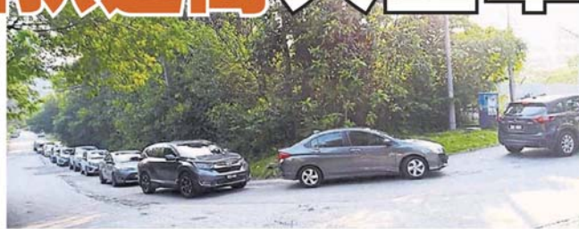
■车龙已延伸至后方的花园住宅区。

此點文也引起许多居民留言反映，众人纷纷不满该区的道路不获修复，另一边却筑起过高的路拱，