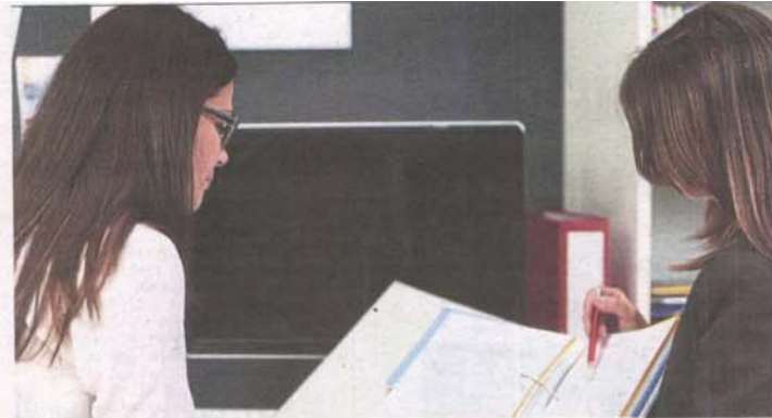
Women who return to work after a career break will be exempted from income tax until 2023.