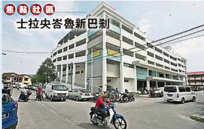
士拉央市议会将于10月16日起，接管士拉央峇鲁新巴刹的垃圾和卫生清理工作。