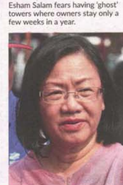
Danker says the budget revolved around civil servants and the B40.