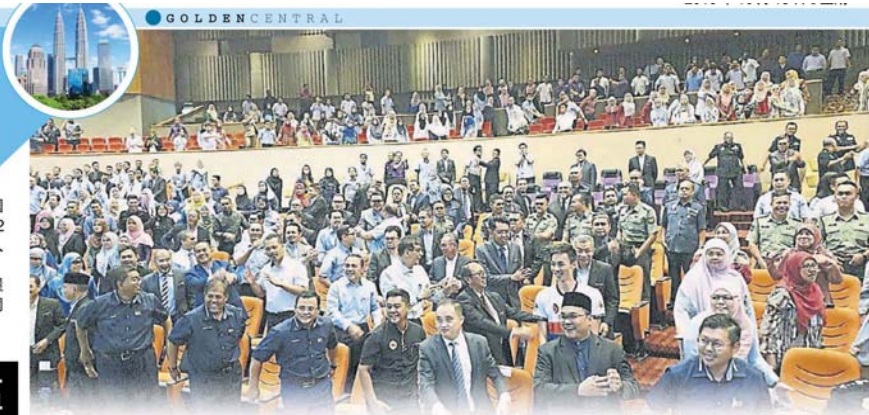
配合国家运动月，运动员在台上带领公务员一起做运动，大家乐在其中。

(莎阿南 14 日讯) 随着中央政府宣布明年起降低外国人买房门槛至 60 万令吉后，雪兰莪州政府料在未来 2 至 3 周内探讨对策，以决定是否重新调整州内外国人购屋政策。 雪州大臣阿米鲁丁表示，州政府已指示雪州房屋与地产局 (LPHS) 重申州内屋价下滑问题，但与此同时，州政府更关注保护州内屋价波动的事宜。