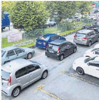
■轿车纷纷塞在自家住家区动弹不得。