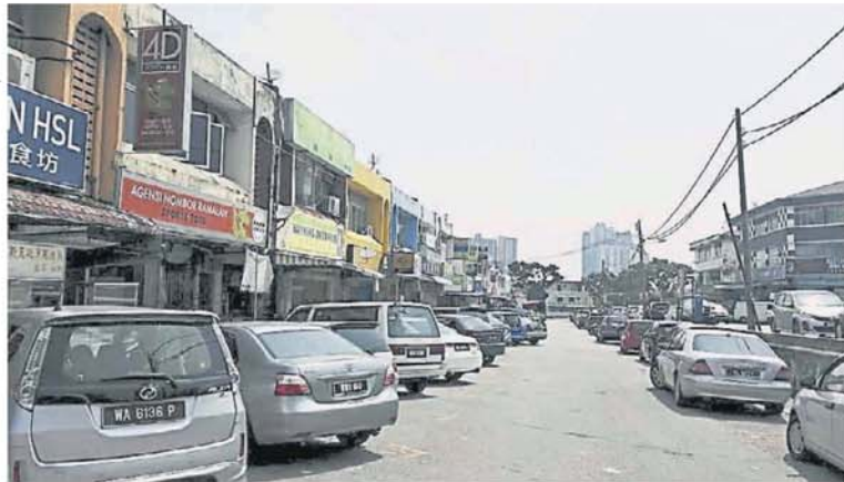
陈明再也花园商业区超过 2 天没水供，商民叫苦。

多，水供公司除安排水车派水，也在该花园回教堂旁设立取水站，让受影响居民到该处取水。