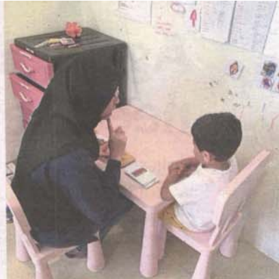
Skilled teachers are needed to train autistic and dyslexic children in urban and rural areas.