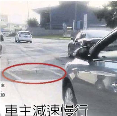
■路拱因过高，车主纷纷减速慢行。(沙登人面书专员的视频所截图)