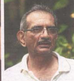
Rajesh says properties need to be built based on the income scale of Malaysians.