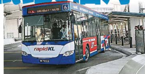
轻快铁接驳巴士T792路线将在10月15日开始试跑, 为期3个月。

他指出, 以前乘客经常询问, 不晓得哪辆巴士有前往轻快铁站, 尤其是推出My50和My100乘车月票, 可无限次乘搭巴士及轻快铁站, 如今只要看到轻快铁接驳巴士, 就肯定会前往轻快铁站。