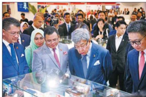
雪州苏丹沙拉弗丁殿下 (右2) 在哈山阿兹哈里、阿米鲁丁及邓章钦的陪同下, 参观商务峰会的参展摊位。

他补充, 今年新增的首届「雪兰莪研发与创新博览会」, 共有120个来自大马学院与大学的参展单位参与, 共透过328个摊位向大众展示他们逾100种的创作与发明。