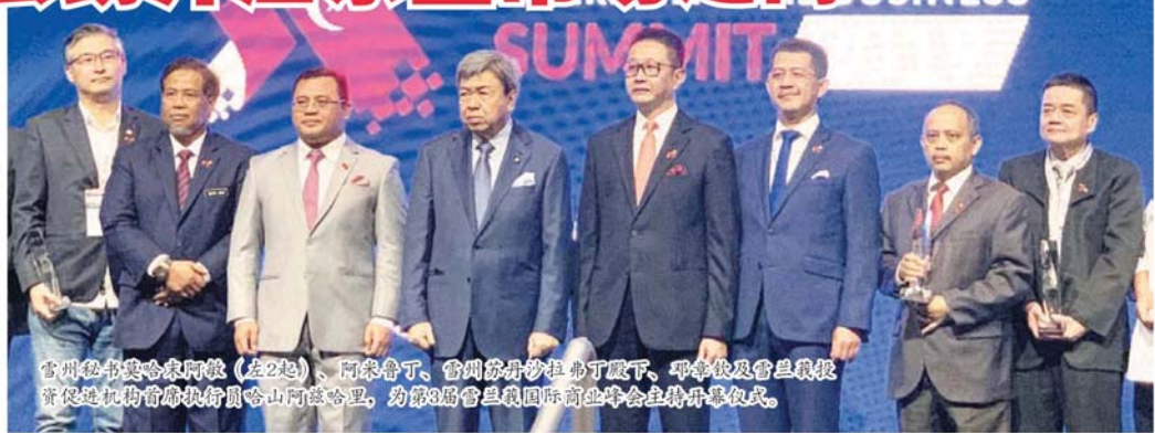
雪州秘书莫哈末阿敏 (左2起)、阿米鲁丁、雪州苏丹沙拉弗丁殿下、邓章钦及雪兰莪投资促进机构首席执行官哈山阿兹哈里, 为第3届雪兰莪国际商业峰会主持开幕仪式。

雪州投资促进机构 (Invest Selangor) 日前于马来西亚国际贸易展览中心 (MITEC), 举办为期4天的「2019年第三届雪兰莪国际商业峰会」, 延续「为你开启东盟之门」为主题, 吸引24个国家和地区参展, 协助海内外商家发掘更多商贸机会。