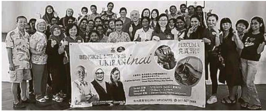
约40多名各族妇女参与“伊娜”手绘体验课程。

Provided for client's internal research purposes only. May not be further copied, distributed, sold or published in any form without the prior consent of the copyright owner.